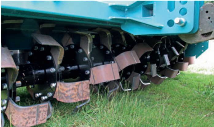
Offener Rotor mit Winkelmessern aus verschleißfestem Bor-Stahl

Für die schwere Bodenbearbeitung im intensiven Ackerbau, in Sonderkulturen wie z.B. für Weihnachtsbäume