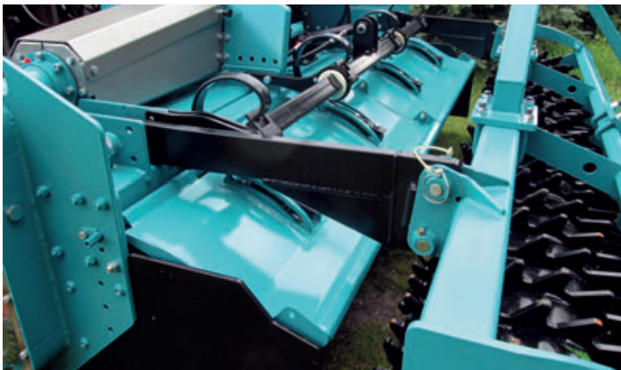
Hydraulisch einstellbare Bodenklappen, wartungsfrei federnd gelagert